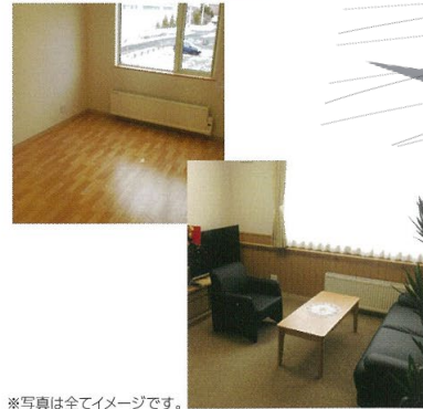
※写真は全てイメージです。